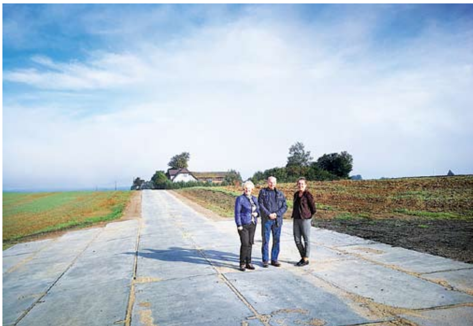
Nowa droga w Rusowie