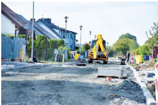
Sianożęty: ulice Liliowa i Wczasowa w trakcie remontu