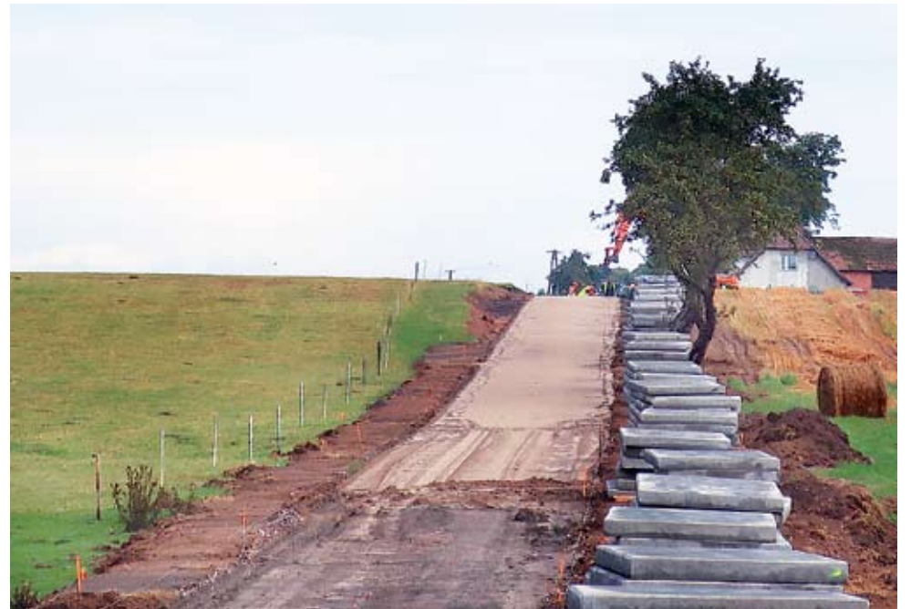
Droga w Rusowie