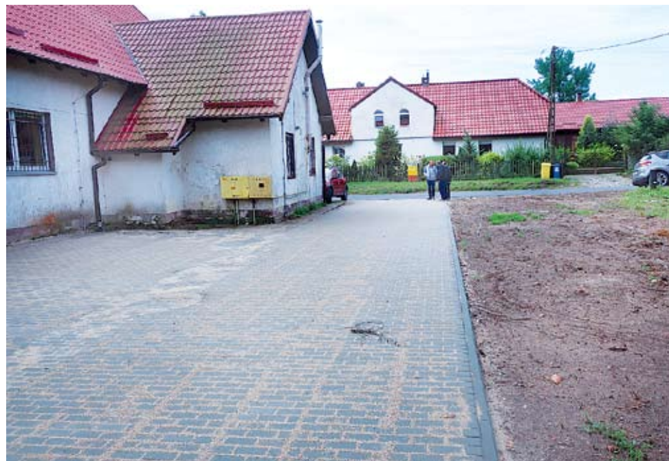
Parking w Rusowie

dniku 2018 roku, od końca listopada pełni funkcję Wójta gminy realizowane w kolejnych miesiącach. Jak zmieniała się gmina na zować?