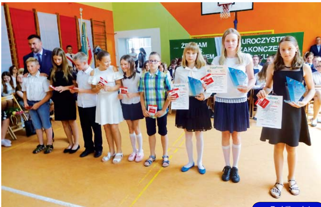
Najlepsi sportowcy: w grupie młodszej - rocznik 2006 i młodsi.