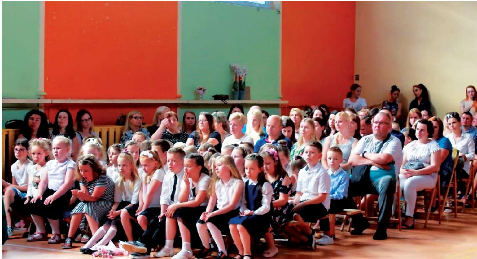
Czekanie na ostatni dzwonek