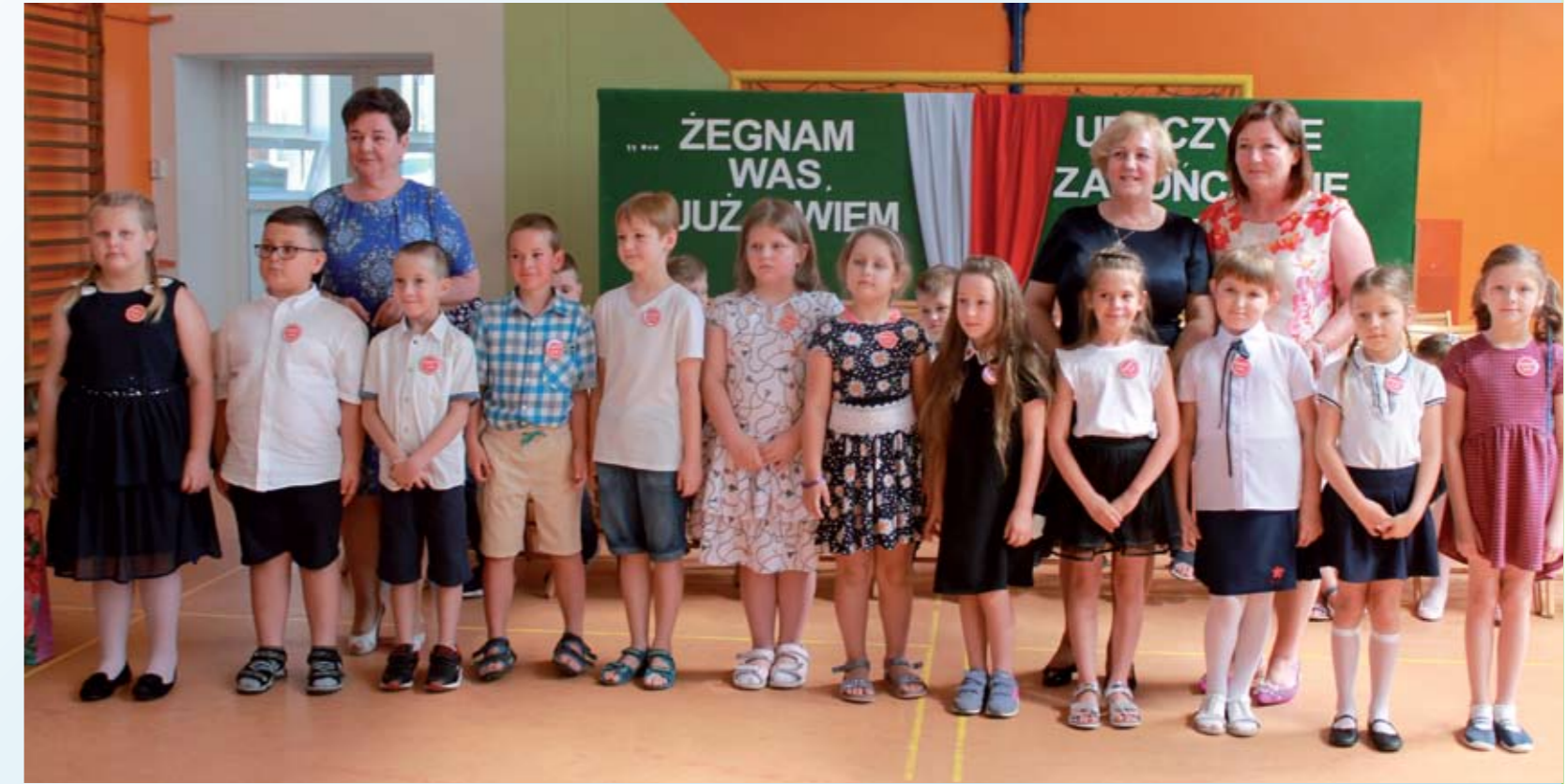
Na zdjęciu cała klasa - II w 100% wzorowi uczniowie